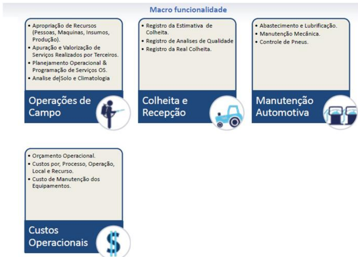
Ilustração 1 - Macro e Micro funcionalidade do Sistema

Seus diferenciais são a interface 100% Web, o layout padronizado, a portabilidade total; a conectividade e a publicação de serviços; a autenticação e autorização; o registro de atividades e auditoria; o controle de transação e uso de recursos; a escalabilidade de eficiência e economizando recursos computacionais; a facilidade na integração. A ilustração 1 abaixo lista algumas de suas funcionalidades.