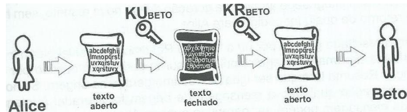
Figura 4 – Criptografia Assimétrica

A Figura 4 mostra o esquema de funcionamento da criptografia assimétrica.