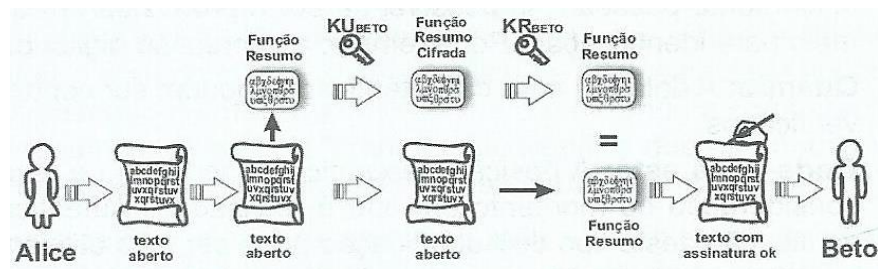
Figura 5 – Processo de Assinatura Digital

O processo de assinatura digital está ilustrado na Figura 5 abaixo.