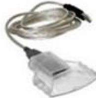
Figura 3 – Leitora de cartão inteligente

Para o caso de se utilizar o cartão inteligente, também é necessária a leitora de cartão, como a da Figura 3, que é conectada via USB.