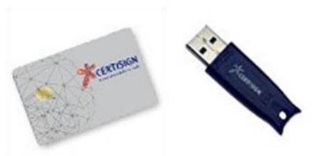
Figura 2 – Cartão inteligente ( smart card ) e token USB

Segundo Alecrim (2016), o armazenamento do par de chaves por hardware é feito em cartão inteligente ( smart card ) com chip ou token USB (dispositivo semelhante a um pendrive ) protegidos por senha, como ilustra a Figura 2. “O sistema ICP-Brasil tem um protagonista essencial, a saber, smart card , o cartão com chip ISO-7816. Nele a chave privada é gerada e nele é armazenada, sem nunca usar a memória volátil do sistema, o que, por fim, lhe ajuda a garantir mais segurança”. (MARTINI, 2008, p.39)