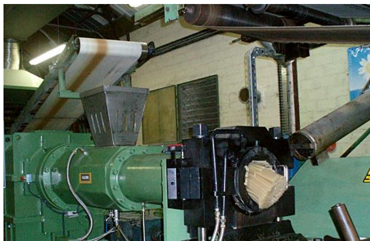
ILUSTRAÇÃO 4. Extrusora-filtradora

borracha cortadas em tiras numa esteira transportadora que levará até o funil da extrusora filtradora, passando o composto pela malha de aço que bloqueará a passagem das impurezas, deixando o composto totalmente límpido. Segue abaixo a ilustração de uma extrusora filtradora: