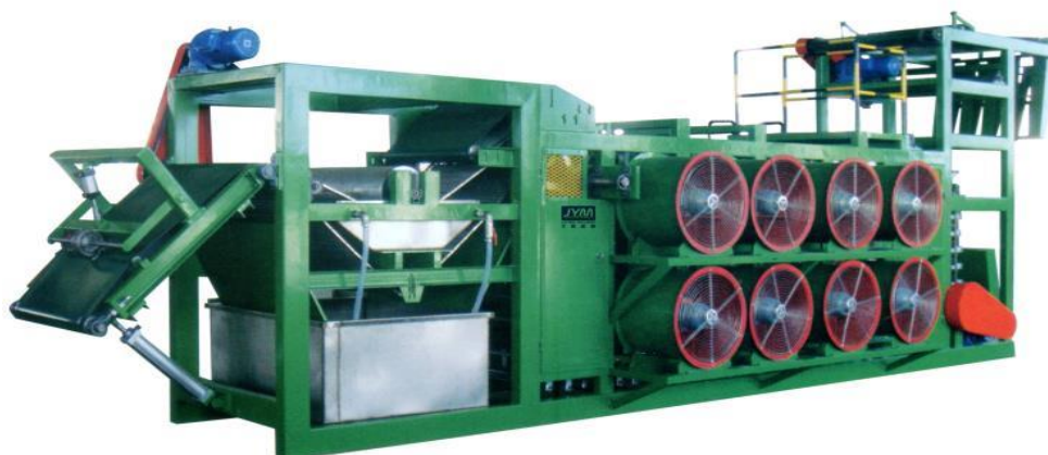
ILUSTRAÇÃO 3. Batch Off

Para que o composto não sofra uma pré-vulcanização devido à alta temperatura em que sai dos misturadores, é necessário passar por um processo de resfriamento e/ou descanso, ficando em repouso em uma máquina chamada batch-off, no qual, contém um sistema de resfriamento, onde em uma câmara fechada o composto passa e recebe esguichos de água e sabão. A Ilustração 3 a seguir mostra um modelo de máquina Batch Off mais utilizado na indústria de artefatos de borracha, em seu interior existe uma esteira com vãos, como se fossem cabides, onde automaticamente as mantas de borracha são penduradas, dando início ao processo de resfriamento com esguichadas de uma solução de água e sabão, depois os ventiladores são acionados secando assim o composto, o final do ciclo se dá pelo empilhamento das mantas em pallets.