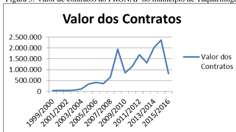
Figura 3. Valor de contratos do PRONAF no município de Taquaritinga