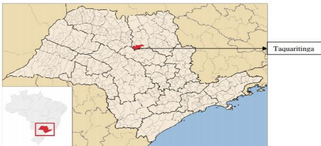
Figura 1. Localização de Taquaritinga no Estado de São Paulo.